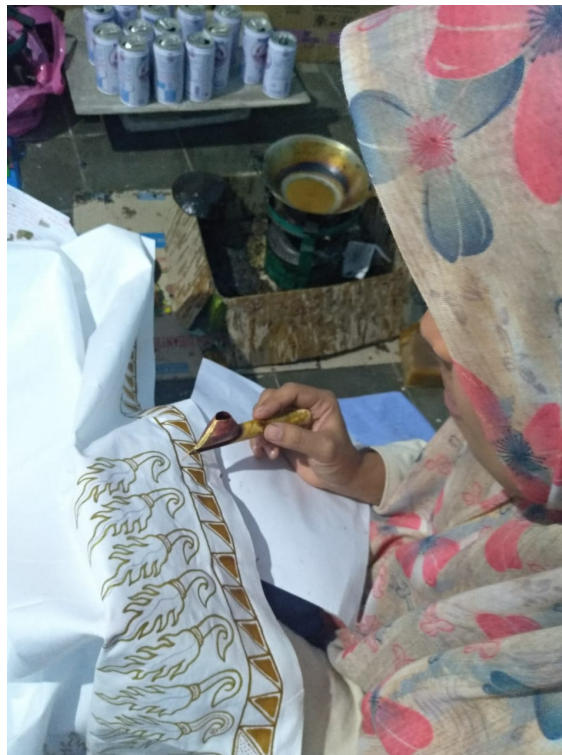
Gambar 2. Tahap Pencanthingan

Setelah selesai tahap pencanthingan klowong ngèngrèng kemudian dilanjutkan dengan pencanthingan isèn-isèn . Isèn-isèn ini memiliki banyak bentuk, sehingga si pembatik harus paham di dalam penempatannya. Pencanthingan isèn-isèn dapat dilakukan oleh pembatik klowong , namun dapat juga dikerjakan oleh pembatik lain yang memang tukang pembatik khusus isèn-isèn . Kain putih dapat dikatakan selesai ngèngrèng kalau batik klowong sudah dilengkapi dengan isèn-isèn . Apabila tahap pencanthingan klowong ngèngrèng dan pencanthingan isèn-isèn selesai dilaksanakan, dilanjutkan dengan proses nerusi atau membatik bagian yang tidak tembus pada bagian kain sebaliknya, baik itu dari unsur klowong ngèngrèng maupun isèn-isèn . Tahap pencanthingan berikutnya adalah diteruskan dengan proses nembok atau menutup bidang kain yang nantinya apabila telah selesai proses pewarnaan akan tetap berwarna putih. Proses nembok ini dilakukan dengan bahan malam tembok batik tulis. Langkah untuk nembok seperti halnya pada nglowong juga diawali dengan ngèngrèng terlebih dahulu, kemudian juga dilakukan proses nerusi atau bolak-balik pada kedua sisi kain hingga selesai. Jika proses ini selesai dilakukan maka proses pencanthingan juga telah selesai dilaksanakan dan siap untuk diproses selanjutnya, yaitu tahap pewarnaan (Samsi, 2007: 34-35).