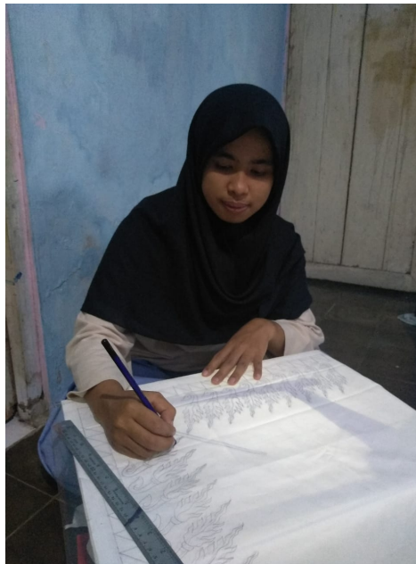
Gambar 1. Proses pembuatan desain dan Pemolaan di atas kain

Desain yang dikerjakan secara manual atau tradisional umumnya sudah memiliki ukuran skala 1:1. Desain ragam hias di atas kertas tersebut diletakkan di atas meja kaca yang diberi penerangan lampu di bawahnya. Desain batik yang berukuran skala 1:1 dapat langsung dijadikan sebagai pola batik dengan cara dijiplak secara langsung dengan meletakkan kain di atasnya. Pemolaan atau nyorèk dilakukan dengan alat gambar berupa pensil dari jenis B yang lunak. Proses nyorèk ini nantinya akan menghasilkan garis rancangan pola batik secara garis besar, yaitu menghasilkan garis klowongan saja. Adapun bagian isian atau isèn-isèn tidak diperinci atau tidak digambar secara khusus.