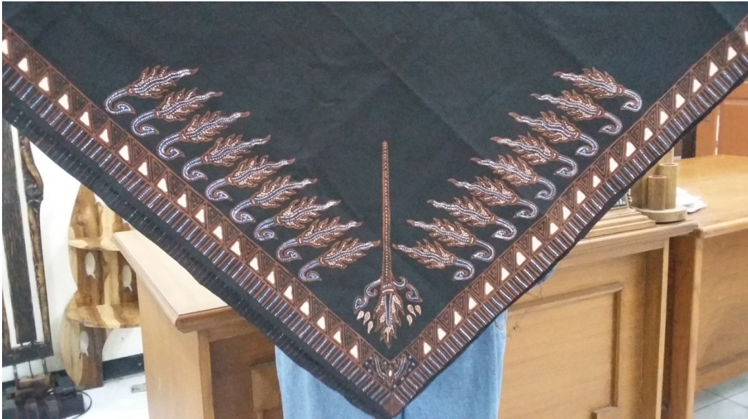
Gambar 5. Contoh udheng selesai dikerjakan