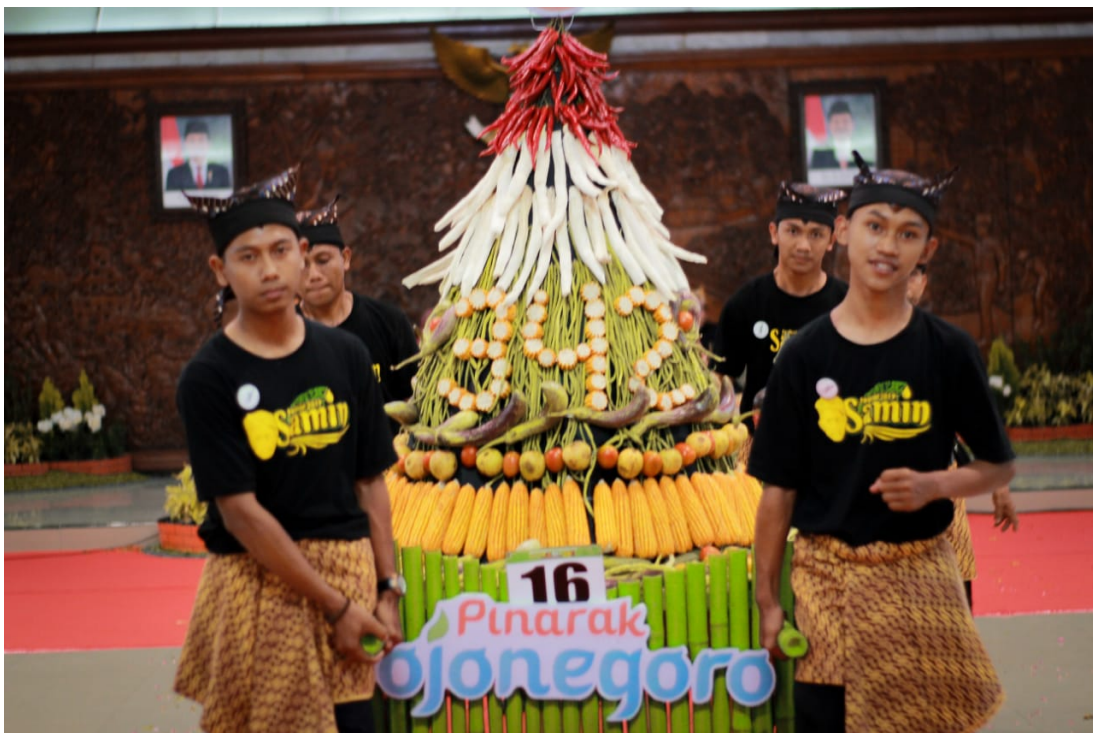
Gambar 6. Udheng , pertama kali dilaunching dalam Gerebeg Berkah dalam rangka hari jadi Kabupaten Bojonegoro ke-342