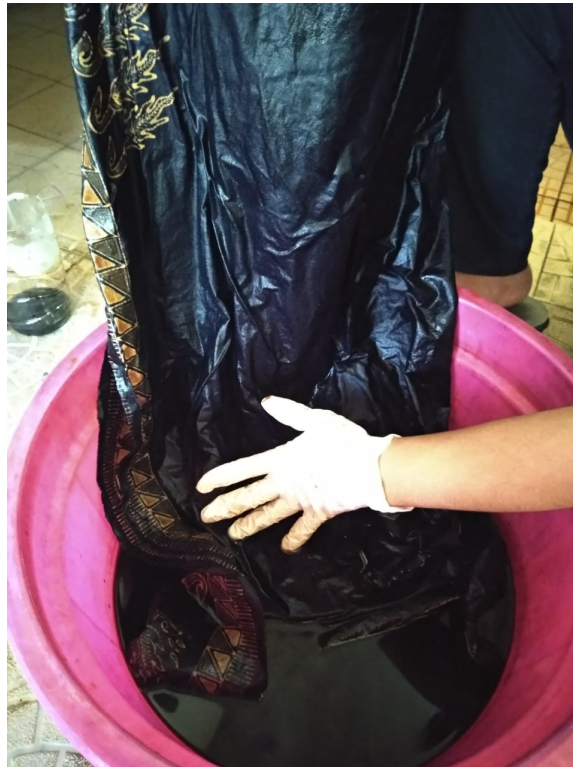
Gambar 3. Tahap Pewarnaan

Bahan warna yang dipakai untuk memperoleh warna biru tua atau wedel untuk kain seukuran kain panjang, meliputi naphtol ASD 3 gram/liter air, TRO 1,5 gram, dan kostik soda atau Loog 28° Be 4,5 cc sebagai larutan pertama. Sebagai pembangkit warna diperlukan garam diazo biru BB 6 gram/liter air sebagai larutan kedua. Cara melarutkan naphtol sebagai larutan pertama adalah dengan cara memasukkan serbuk naphtol dan TRO ke dalam mangkok, tambahkan kostik soda atau Loog 28° Be. Setelah itu campuran ini diaduk rata hingga menjadi pasta. Tambahkan pasta tersebut dengan air mendidih 200 cc ke dalam ember atau bak pencelupan, aduk rata sedikit demi sedikit hingga warna menjadi jernih. Selanjutnya tambahkan air dingin sebanyak 800 cc kemudian juga diaduk hingga merata. Untuk larutan kedua adalah melarutkan serbuk garam diazo dengan air biasa tanpa diberi tambahan bahan bantu sama sekali. Caranya hampir sama dengan cara melarutkan serbuk naphtol , yaitu serbuk garam diazo diberi air sebanyak 1 liter, namun dilakukan sedikit demi sedikit secara bertahap, sambil diaduk-aduk hingga larut secara sempurna dan tidak menggumpal.