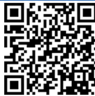
Gambar 4. Qr code sajian gendang Bone sebelum acara pernikahan