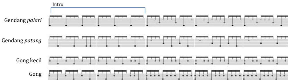
Gambar 5. Notasi dominan ensambel gendang bajo (Bone)

Selain pada acara pernikahan, gendang Bone juga hadir dalam ritual Mattompang Arajang atau pencucian benda pusaka kerajaan Bone. Hal ini dapat dilihat dari unggahan kanal YouTube ART PROJECT BONE yang memperlihatkan gendang sandro (jenis gendang Bone) dimainkan untuk mengiringi proses membersihkan benda pusaka. Terlihat juga pada unggahan kanal YouTube kabarta yang menampilkan gendang bali sumange (juga jenis gendang Bone) saat mengiringi proses membersihkan benda pusaka. Gendang dianggap sebagai hal yang wajib dalam ritual Mattompang Arajang . Gendang Bone dianggap sebagai hal yang sakral, repertoar yang dimainkan bali sumange merupakan simbol dari semangat orang Bone dalam konteks spiritual. Hal ini disampaikan oleh salah satu pelaku seni di Watampone dalam video unggahan kanal YouTube Muh. Aidil Fitriawan. Berdasarkan hal ini, dapat ditarik benang merah bahwa kehadiran gendang Bone dalam perhelatan masyarakat tidak hanya sebagai hiburan tapi juga hal yang sakral, selain itu kehadiran gendang Bone juga sebagai bentuk usaha pelestarian, baik secara langsung atau sadar maupun tidak.