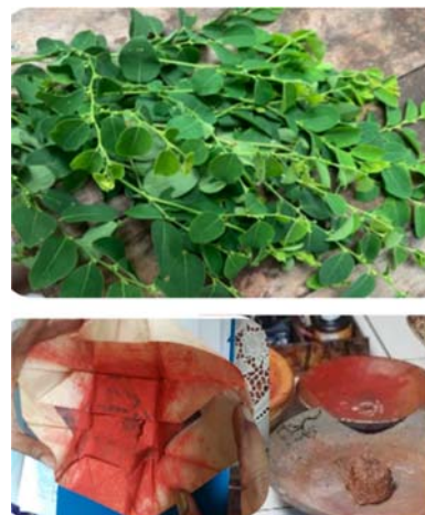
Gambar 1. Bahan warna dari alam

Gambar 1 menunjukkan bahan warna alami yang secara tradisional digunakan dalam seni lukis Wayang Kamasan. Berdasarkan wawancara dengan pelukis dan pemangku budaya, pergeseran seniman dari pigmen alami ke pigmen sintetis bukan disebabkan oleh pudarnya nilai ekologis, melainkan oleh menyusutnya ekologi fisik yang menopang tradisi pewarna alami. Para seniman menegaskan bahwa mereka tetap menghargai warna alami dan nilai ekologisnya, tetapi keterbatasan bahan baku menjadi hambatan mendasar dalam produksi